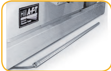
Air Drop Stange