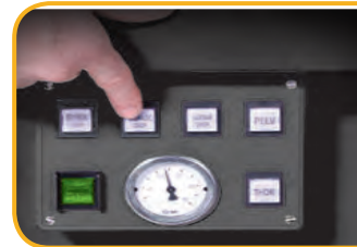
Druckluft Drops in standard

zervikal Thorax Lendenwirbel Becken Breakaway Thorax freigegeben