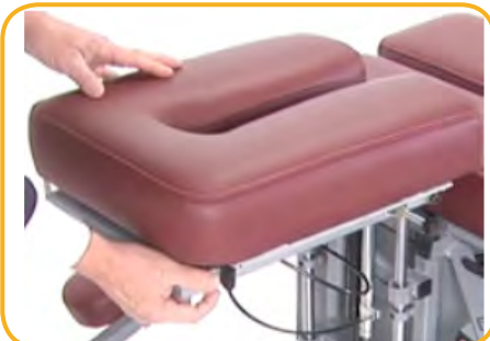
Aufrechte und nach unten gerichtete Kopfstütze